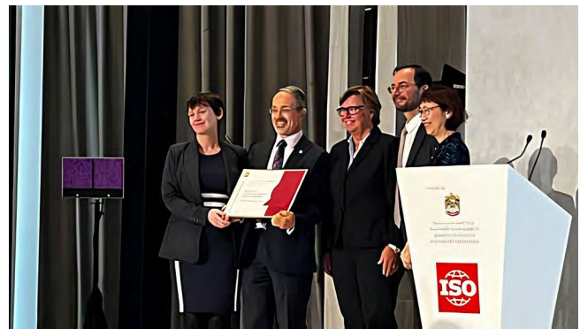
Вручення групі технічного комітету ISO/TC 283 нагороди ISO Excellence Award імені Лоуренса Д. Айхера

Технічний комітет ISO/TC 283 розробляє та публікує стандарти ISO у сфері управління охороною здоров'я та безпекою праці й тим самим: